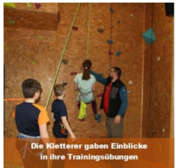
Die Kletterer gaben Einblicke in ihre Trainingsübungen