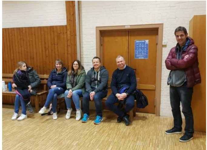
Die Spieler/-innen haben sich ihre Fan-Club in Person der Eltern und Geschwister mitgebracht.