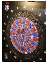
Uwe Melchior 07. März 2022