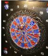
Björn Jäger 08. April 2021