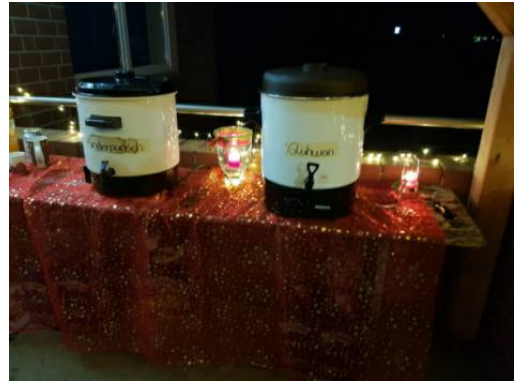
Die Glühwein- und Kinderpunsch-Behälter waren gut gefüllt.