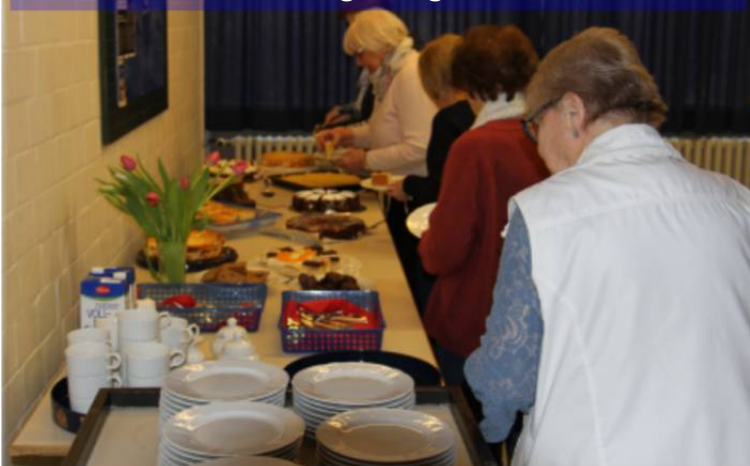
Das Kuchenbuffet war reichhaltig, extrem lecker und wurde sehr gut angenommen

Auf der Leinwand wurden Diashows von Familientagen und Festen aus den letzten Jahren gezeigt. Dazu gab es kurze Filme von Sportereignissen und Auftritten der Rope Skipper. Außerdem waren Stellwände zu besichtigen. Zudem konnte man die zum 100 jährigen Jubiläum verliehenen Plaketten des Bundespräsidenten und des Landesportbundes bestaunen.