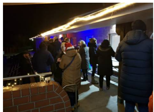
Weihnachtlicher Tischschmuck, Kerzen und diverse Lichterketten konnten vorweihnachtliche Stimmung verbreiten.