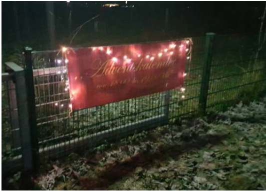
Der Banner war schon von weitem zu sehen und lud zum Eintreten ein.