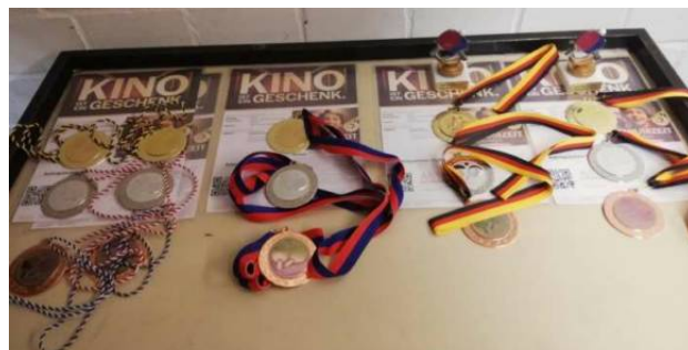
Die Preise: Pokale, Kinogutscheine, Medaillen und Urkunden