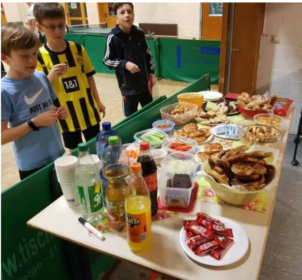
Die Leckereien und Erfrischungen, die die Eltern beige-steuert haben, konnten sich sehen lassen.