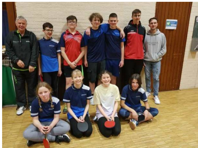
Die Teilnehmer bei den „Profis“- v.l.n.r hinten: