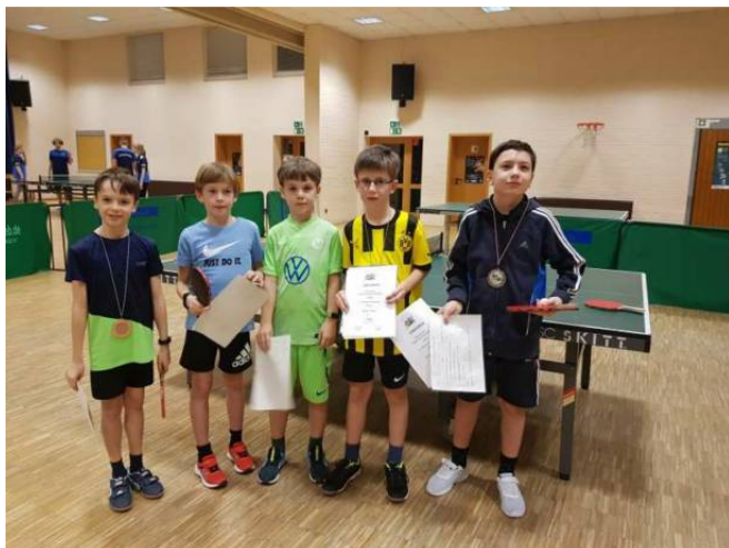
Die Teilnehmer bei den „Anfänger-Wettbewerb“- v.l.n.r.: