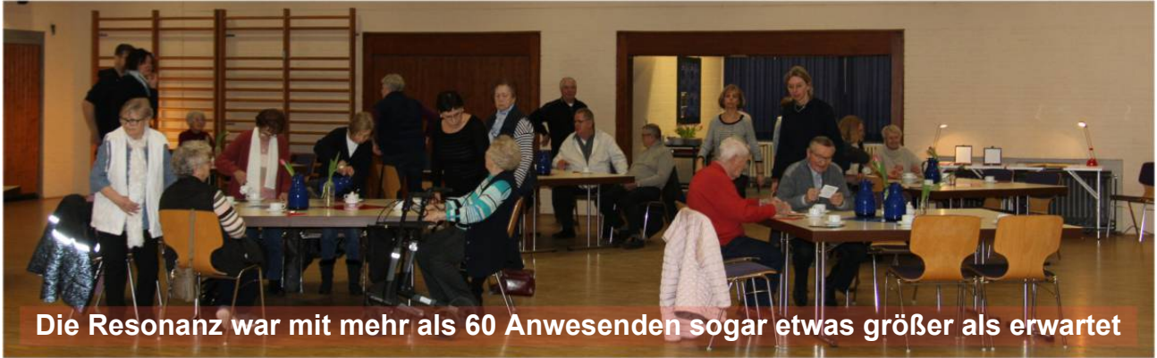
Die Resonanz war mit mehr als 60 Anwesenden sogar etwas größer als erwartet